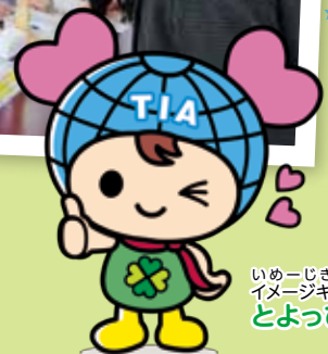
いめーじきゃらくたー イメージキャラクター とよっぴー

しんがたころなういるすかんせんしやうこくないまんえん 新型コロナウイルス感染症が国内に蔓延して3度目の春を迎え ました。変異ウイルスが次々に出てきて、まだ終わりそうにありま せん。豊川市に住んでいる外国人の方々も帰国できなかつたり、新 たに来日することができなかつたりして、家族に会えない寂しさや 心細さを感じながら暮らしているでしょう。