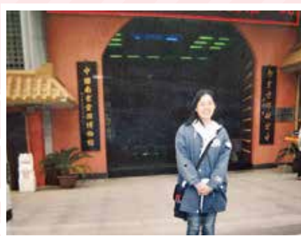
なんきん くもにしき おりものほくぶつかん ▲南京 雲錦 (織物博物館) にて