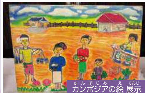
かんぼじあ え てんじ カンボジアの絵 展示