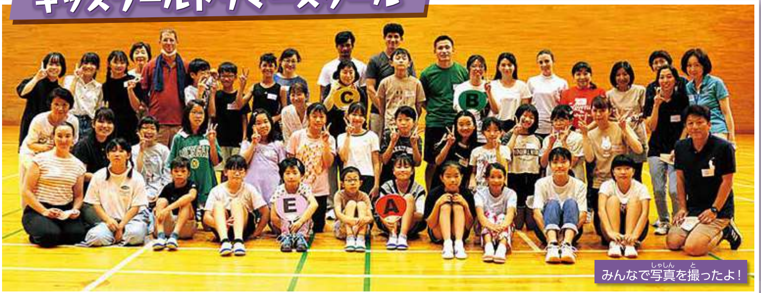
みんなで写真を撮ったよ!