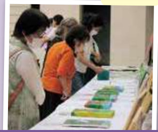
かずかず かんぼじあ え かんしょう 数々のカンボジアの絵を鑑賞

『やさしい日本語の車内放送を開始します』こう書かれた駅のポスターがSNSで話題になっているという記事を見つけました。「やさしい日本語」が生まれたのは、外国人も多く被災した1995年の阪神・淡路大震災の時だったそうです。「やさしい日本語」が多くの人に認知され、広まっていくといいなあと思います。